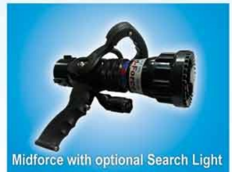
Midforce with optional Search Light