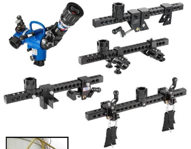
布利斯水力自摆移动炮