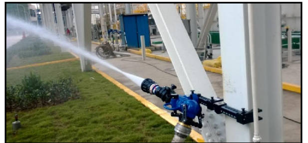
海米斯多空间移动炮