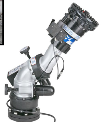
车载遥控炮（季风&小季风）